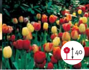
Tulipán híbrido Darwin