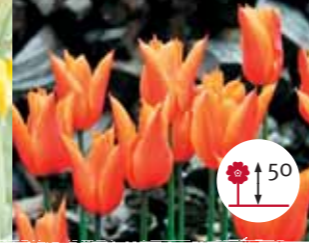
Tulipán flor de lis