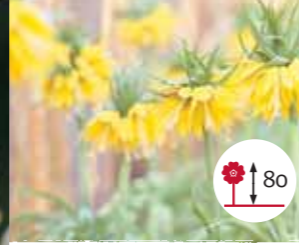
Corona imperial (Fritillaria)