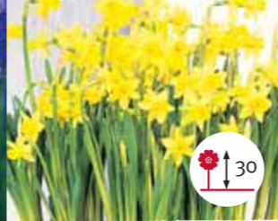
Narciso de rocalla