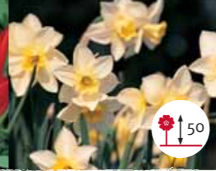
Narciso de corona grande