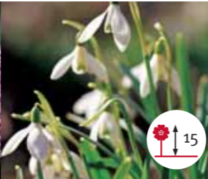
Campanilla de las nieves